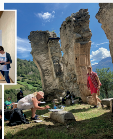
Impressionen aus „Oh, wie schön ist Himmelblau“ Kursjahr 2022